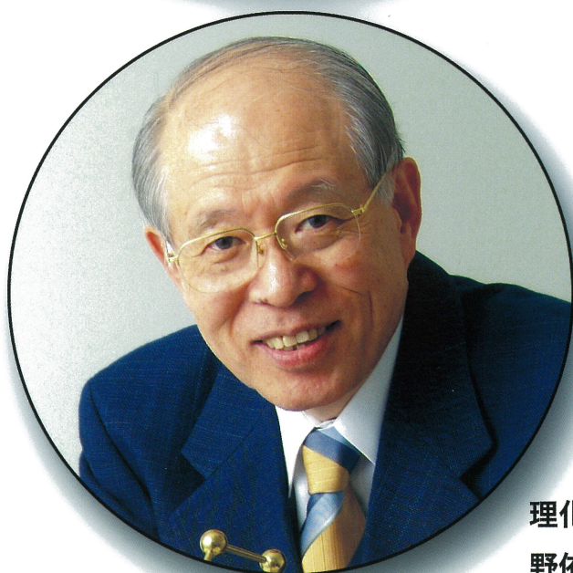
理化学研究所 野依良治理事長